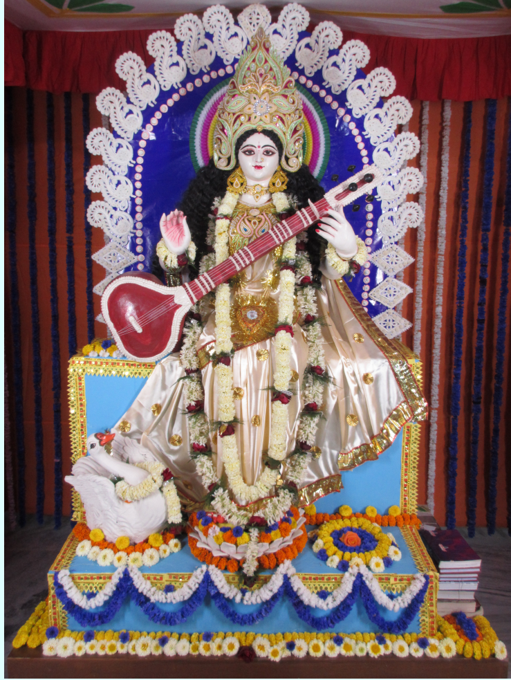
अस्मद्विश्वविद्यालये पूज्यमाना देवीप्रतिमा