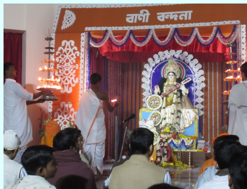
अस्मद्विश्वविद्यालये देव्या नीराजनम्

शरणं करवाणि शर्मदं ते चरणं वाणि चराचरोपजीव्यम्। करुणामसृणैः कटाक्षपातैः कुरु मामम्ब कृतार्थसार्थवाहम्॥