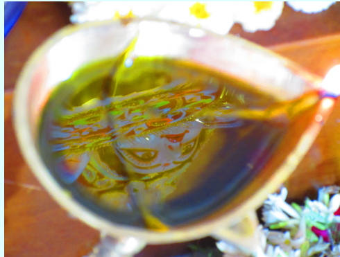
(चित्रं तथागतमण्डलेन स्वीकृतम्)