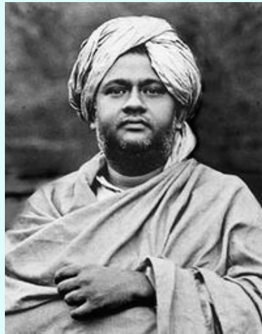
[चित्रम् अन्तर्जालात् स्वीकृतम्]