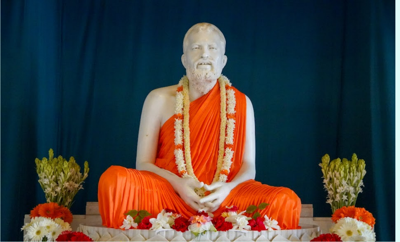
[बेलुडमठे श्रीश्रीरामकृष्णपरमहंसदेवस्य चित्रम्]

आगत्य मेघम् अपासारयत् । साधु तद् दृष्ट्वा प्रकोष्ठात् वहिः आगत्य सङ्गीतशालायाः अलिन्दे स्थित्वा भीषणं हासं कुर्वन् अनृत्यत् । तं तथा दृष्ट्वा ठाकुरः अपृच्छत्, 'त्वया तु प्रकोष्ठस्य मध्ये एव तुष्णीं स्थीयते, अद्य पुनः आनन्द-नर्तनं कथम् ।' तदा साधुः अवदत्, 'संसारस्य माया इयमेव । प्रथमक्षणे स्वच्छः आकाशः, परन्तु झटिति मेघः आगत्य अन्धकारं करोति । एवं किञ्चित् परं यथा आसीत् तथा एव भवति ।'